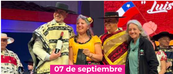
Nacional de Cueva Adulto Mayor