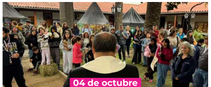
Día de los Animales