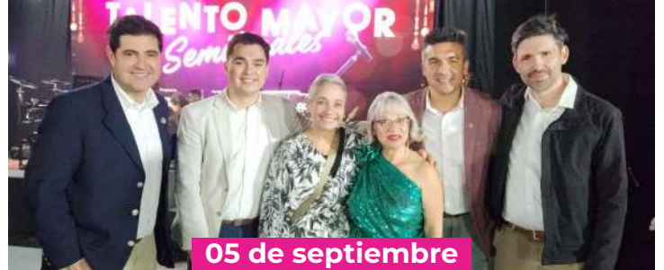
Semifinal Talento Mayor