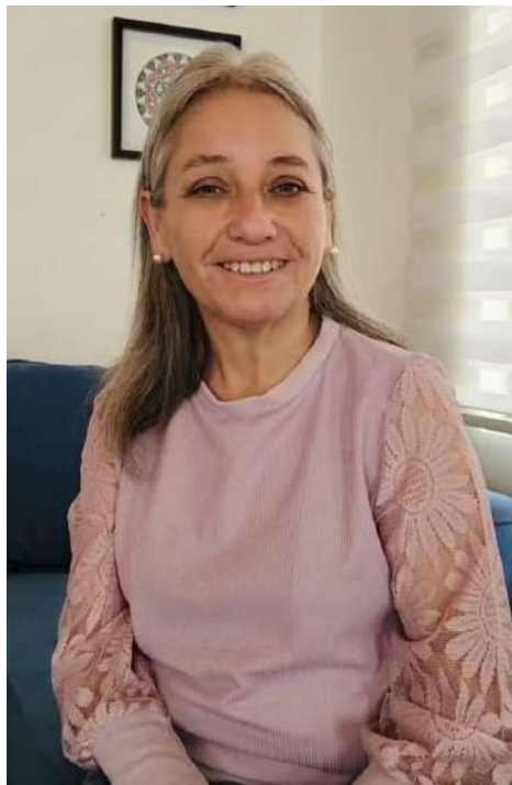
Hortensia Mora Catalán Alcaldesa de Calera de Tango