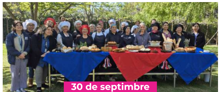
Exposición Curso Panadería Vegana