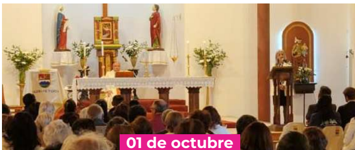
Misa Adulto Mayor